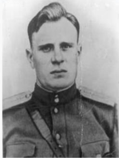
Мелитон Варламович Кантария